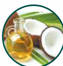
নারকেল বা তিলের তেল