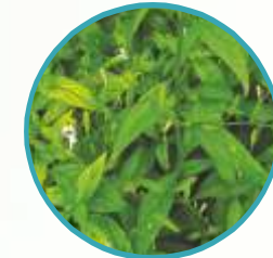
চিরতা পাতার গুঁড়ো